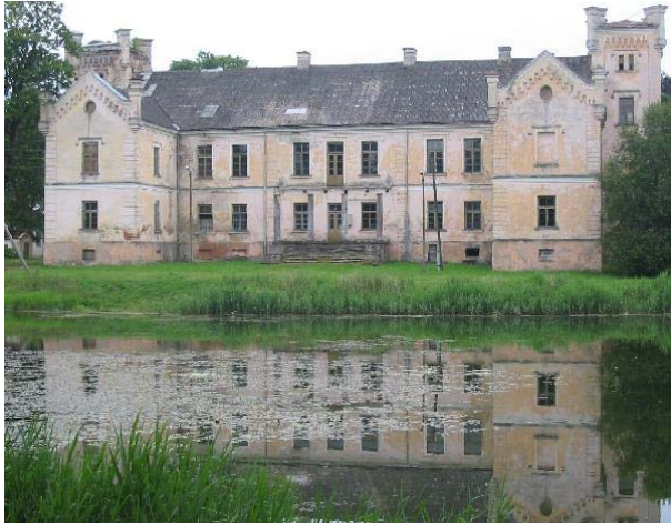
Cīravas muižas pils