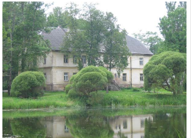
Cīravas muižas Ārsta māja