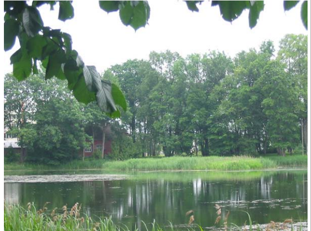
Cīravas muižas parks